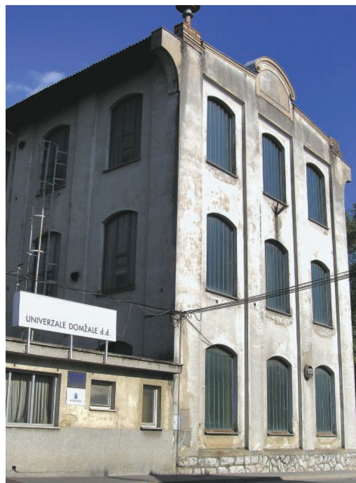
► Poslopje nekdanje tovarne Univerzale je bilo zgrajeno pred dobrimi sto leti in danes velja za eno najbolje ohranjenih secesijskih gradenj na Slovenskem.

Taja J. Gubenšek, Muzejsko društvo Domžale