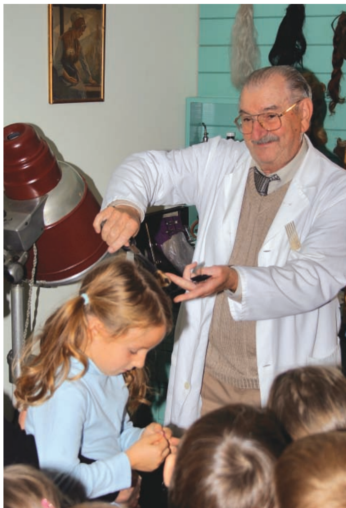
► V ambientalni postavitvi ulice obrtnikov se lahko sprehodimo tudi med obrtnimi lokali, ki ob določenih dnevih resnično zaživijo, posebne didaktične točke na razstavi pa omogočajo poglobljanje znanj ter motivirajo in usmerjajo mlade obiskovalce.

Celje se ponaša z dolgo in bogato tradicijo. O pestrih in burnih stoletjih mesta ob Savinji pa najbolje priča ohranjena materialna dediščina, tako iz najstarejših obdobij kot iz njegove polpretekle, tako rekoč še sveže in žive zgodovine 20. stoletja.