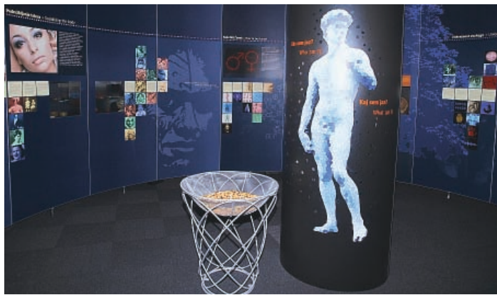
► Nova stalna razstava umešča muzealizirano dediščino v domišljen idejni koncept in je tako inventiven prispevek k pojmovanju mnogoterih funkcij sodobnega muzeja.